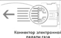
Коннектор электронной педали газа

Нажмите на эту часть и потяните на себя для отсоединения.