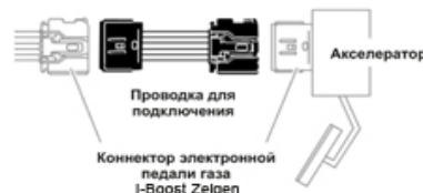
Проводка для подключения I-Boost Zeigen